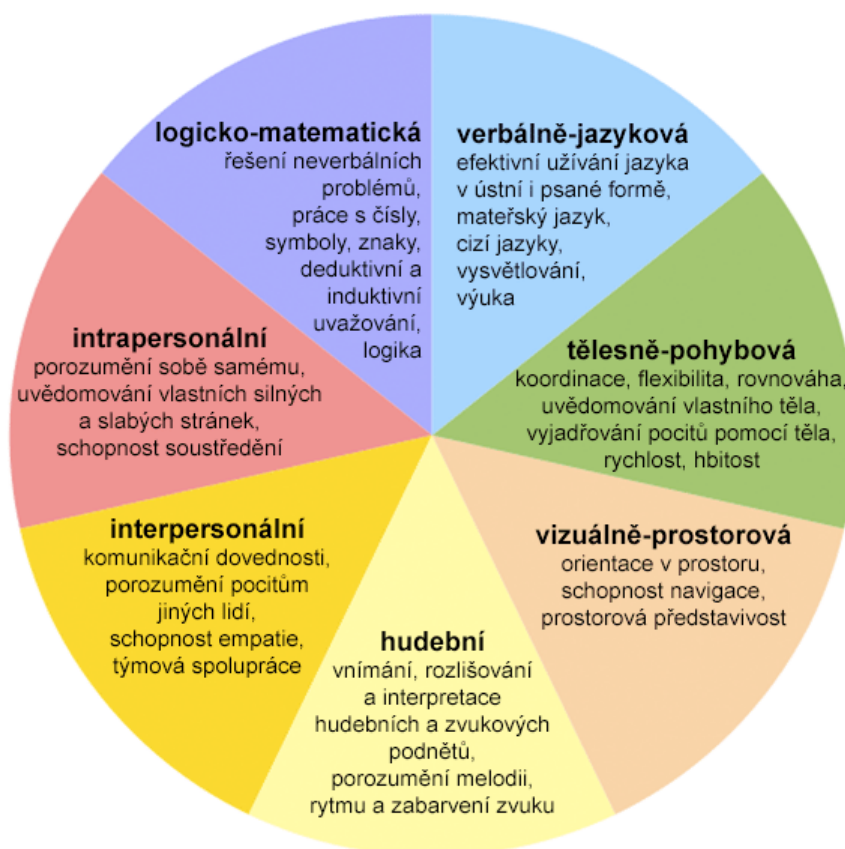
Schéma teorie mnohonásobné inteligence

Rodiče i učitelé často pozorují na dětech (nejen nadaných), že v jedné oblasti vynikají, zatímco v druhé jsou zcela průměrné a v další třeba i výrazně zaostávají. Netýká se to samozřejmě jen dětí, ale i dospívajících a dospělých. Čím to je? Jedním z možných vysvětlení je tzv. teorie mnohonásobné inteligence.